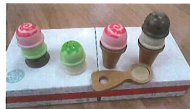
アイスクリーム屋さん