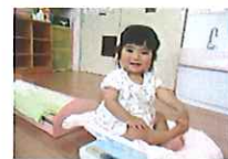
9月に行った発育測定の様子☆