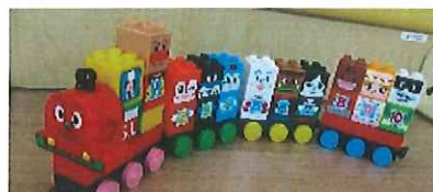
アンパンマンのブロック